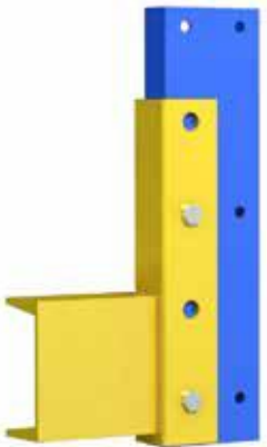
V3" x 3.5 lb/ft V3" x 4.1 lb/ft