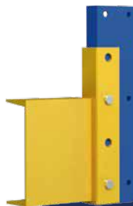
▶ V5" x 6.7 lb/ft