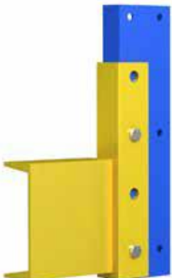
▶ V4" x 4.5 lb/ft V4" x 5.4 lb/ft