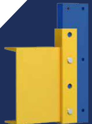
▶ V6" x 8.2 lb/ft