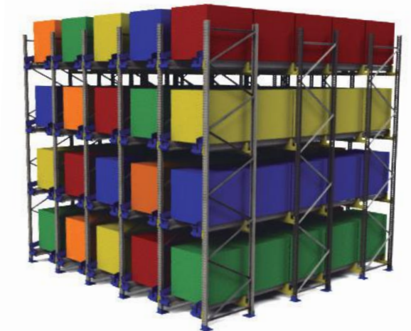
Interflo Pallet Shuttle